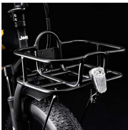
Cestino anteriore incluso