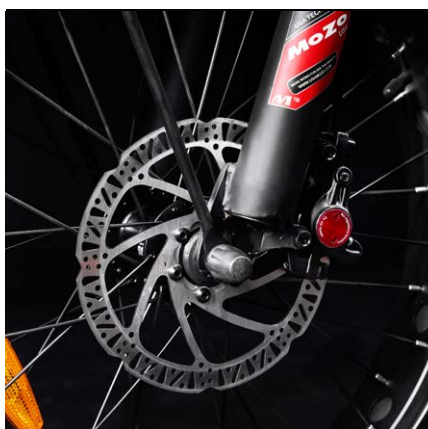
Freni a disco idraulici